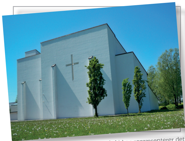
Klostermarkskirken repræsenterer det moderne kirkebyggeri fra vor tid.

På denne rundtur, som kan starte ved Ahornhallen eller ved Klostermarkskirken (der er P-plads begge steder), opleves å-dalens dejlige natur. Rundturen er på 4.1 km og fører forbi en moderne kirke og nær et sted, som repræsenterer en del af å-dalens kulturhistorie; Høm Mølle.