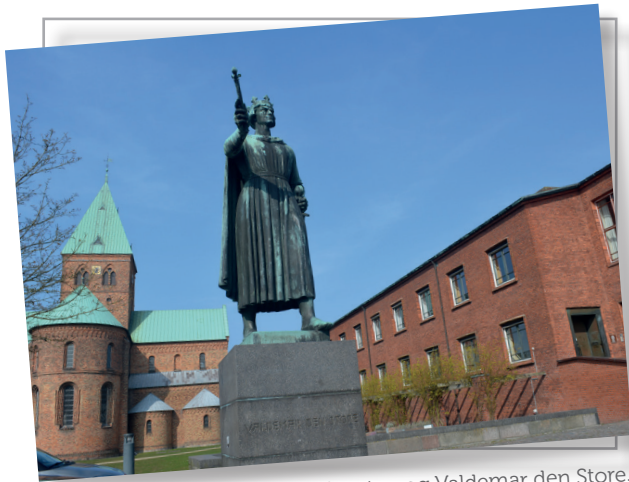
Sct. Bendts kirke, Rådhuset, tingsten og Valdemar den Store.

Turen fører forbi mange spændende lokaliteter. Første stop på turen er Sct. Bendts kirke og Rådhuset.